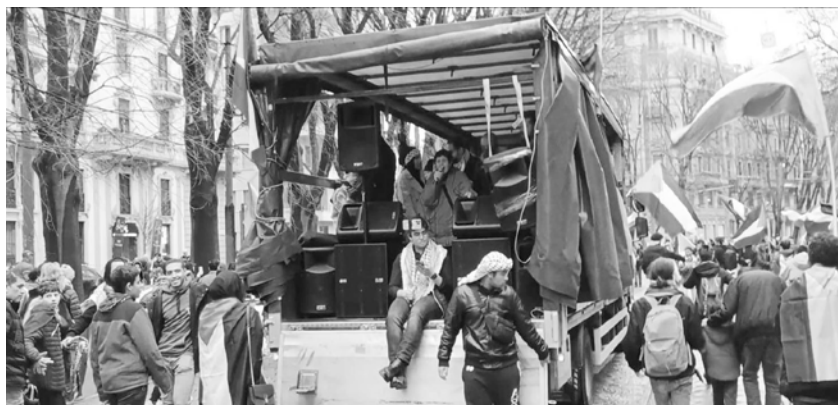
L'intervento della compagna di proletari comunisti dal camioncino della manifestazione

Abbiamo fatto appello a far sì che il G7 in Puglia sia una nuova grande occasione perché l'intero movimento di solidarietà con la Palestina si unisca a tutte le